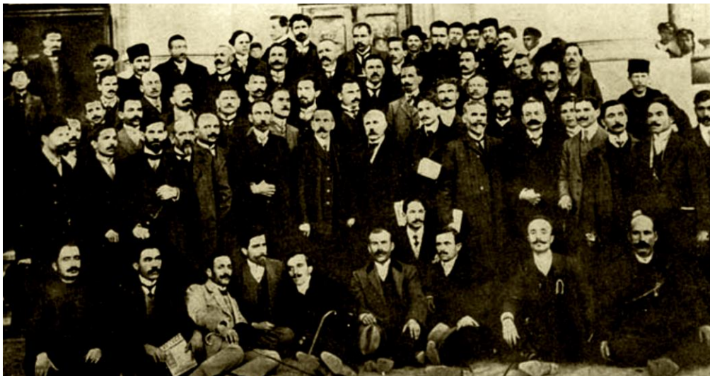
Учредителите на Читалищния съюз